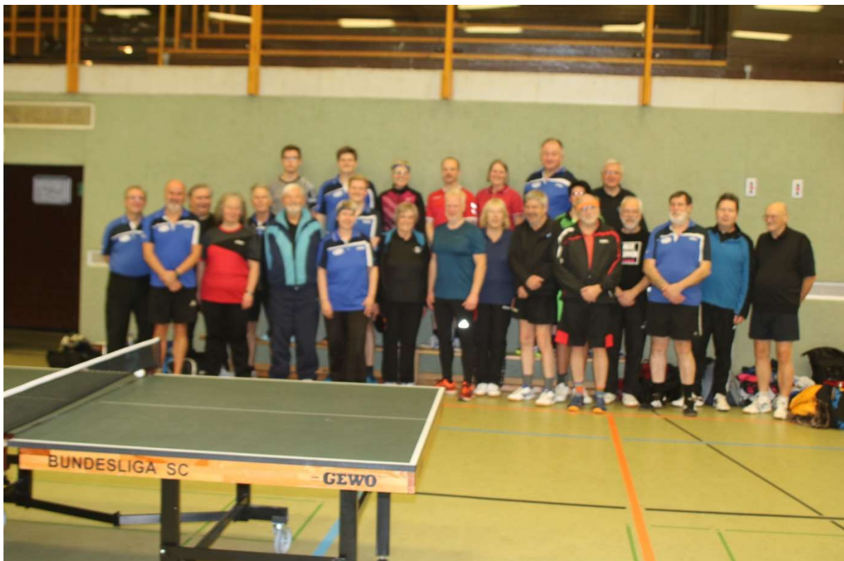
Hinweis zum Bild: Das Teilnehmerfeld des Weihnachtsturnieres 2023

26 Teilnehmer (6 Damen, 20 Herren) waren am Start, als es am Montagabend um 19:00 Uhr losging.