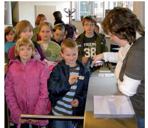
Einlasskontrolle mit dem Deutschen Sportausweis bei der DLRG Bückeburg

Die Lösung mit dem Deutschen Sportausweis