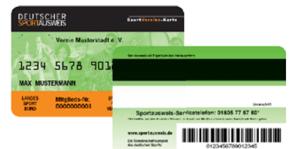
Vorder- und Rückseite des Deutschen Sportausweises

* 0,14 €/Min. aus dem Festnetz, max. 0,42 €/Min aus dem Mobilfunk.